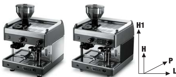
Caratteristiche tecniche della serie COMBINOVA

MARCHI DI OMOLOGAZIONE / MARCHI DI OMOLOGAZIONE / MARCHI DI OMOLOGAZIONE / MARCHI DI OMOLOGAZIONE / MARCHI DI OMOLOGAZIONE